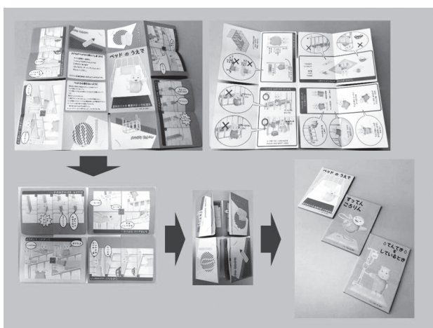
図1 事故危険回避教育ツールを絵本型に作成する過程

ツールを用いた事故防止の具体的援助は、①入院児と保護者に入院時オリエンテーションの中で従来から行われている事故防止に関する説明を行った上で、②入院当