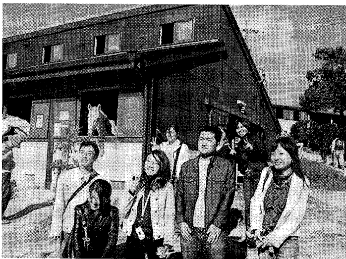
写真6 留学生諸君とバーベキューを食べに 愛知牧場（'06年11月）

昼間主コースの推薦入試は、定員5名に対して毎年20人前後の志願者があり、制度として、また外部からの評価も定着していると思う。合格後、それを辞退した例もない。推薦入試について、廃止しては？、との意見を聞いた記憶があるが、わたしは残すべきであると考えている。視点を変えて今、外を見渡すと、すでに“志願者全入”の時代に入っている。県大の今後を考えて、そのようなことはまったく想定したくないが、入学定員の確保のために推薦入学枠を拡大する大学が増加しているようである。少し前の新聞に、入学定員数に対する推薦入学枠の比率を制限するべきだ、との議論が文部科学省内にある、との報道が出ていた。このような事態も一応、頭のどこかには置いておいて、定着したこの制度は維持すべきだと思うのである。社会人の入学志願者は、残念ながら明らかに減少している。とくに昼間主コースにおいてその傾向がいちじるしい。夜間主コースにおいても、定員枠を減らし、さらに'07年度からは、A、Bの区別もなくした。編入学制度も大学全体を見ると志願者の減少が明らかで、'08年度から廃止することが決まっている。日本文化学科について見ると、他学部、他学科に比べて志願者数は少なくないものの、試験の結果、合格者が定員を満たすかどうか、という現状であろうか。社会人、編入学ともに問題点はあるが、制度としては残すべきものであると、今でもわたしは考えてる。この2つの選抜方法は現役の高校生を対象とする