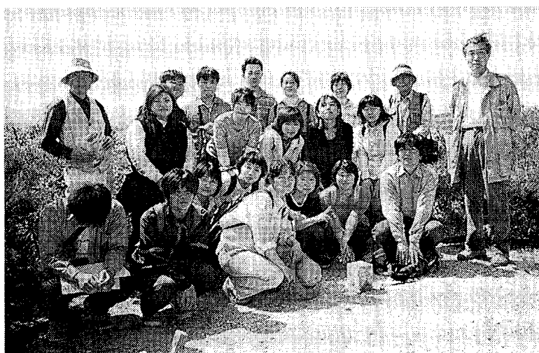
写真5 教養演習で海上の森見学 三角点を囲んで ('05年5月)

昼間主が倍率で5倍程度、夜間主が6倍程度で推移している。県大では考えられる入試方法はすべて実施しているといつてよいほどで、まさに、“入試のデパート”である。志願者数の推移を見ると、'99年度以降、昼間主コース志願者は130～