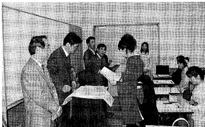
写真7 卒業証書の授与式（'06年3月）

第1期生の諸君が3年生に進むようになって、学生時代の後半をどう指導すべきか、の検討が学科内で始まった。主として、3、4年次の履修の中心となる演習をどう履修させるべきか、卒業論文の指導をどうすべきか、であったと思う。3年次