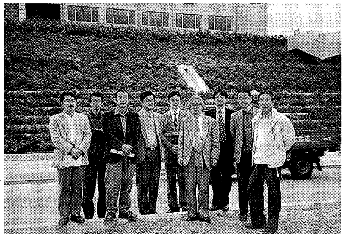
写真1 完成した新キャンパスの見学に ('98年2月)

この間、'94年以降、新キャンパスの整備（測量、造成、建物の建設）が並行して進められている。また、わたしたちの学科に関して、重要な変更があった。'93. 3の「基本構想」で、それまで予定していた「歴史文化学科」の名称が「日本文化学科」に改められた。学科名称の変更はカリキュラムの一部、教員配置の一部を変更せざるを得なかった。ただし、“日本史を中心にする。ただし、日本史だけにはしない”、ということは、わたしたちのグループでは早くから合意されていたことであって、学科名称の変更に関わらず、学科構想の基幹部分は維持されたと考えている。なぜ、「歴史文化学科」から「日本文化学科」に変更したか、その理由については憶測が入るのでここでは述べないが、決してわたしたちが希望し、提案したものでなかったことは明記しておく。教員定数は県から総数の内示があった後、'94年中に学内の会議で決まった。結構激しい議論があったと記憶しているが、日本文化学科には12名が割り当てられた。学生定数は当初、昼間主40、夜間主20を予定していたが、最終的に現在の昼間主30、夜間主15、の数字が確定したのは文部省との事前相談が定期的に行われるようになった後のことである。当時、“学生定員の原則抑制”という大枠がかぶせられていて、それをどうクリアするか、という細かい、うんざりするやり取りの結果であった。当初、完成年は'96年を予定していたが、基本計画では2年繰り下げられて、'98年となった。一時、さらに2年繰り下げられそうだと、という話を聞いたこともある。ともあれ、県に大学から計画が提出されてから10年を要した“大事業”であった。もちろん