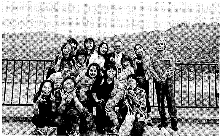
写真3 新入生歓迎旅行 御母衣ダムサイトにて ('00年5月)