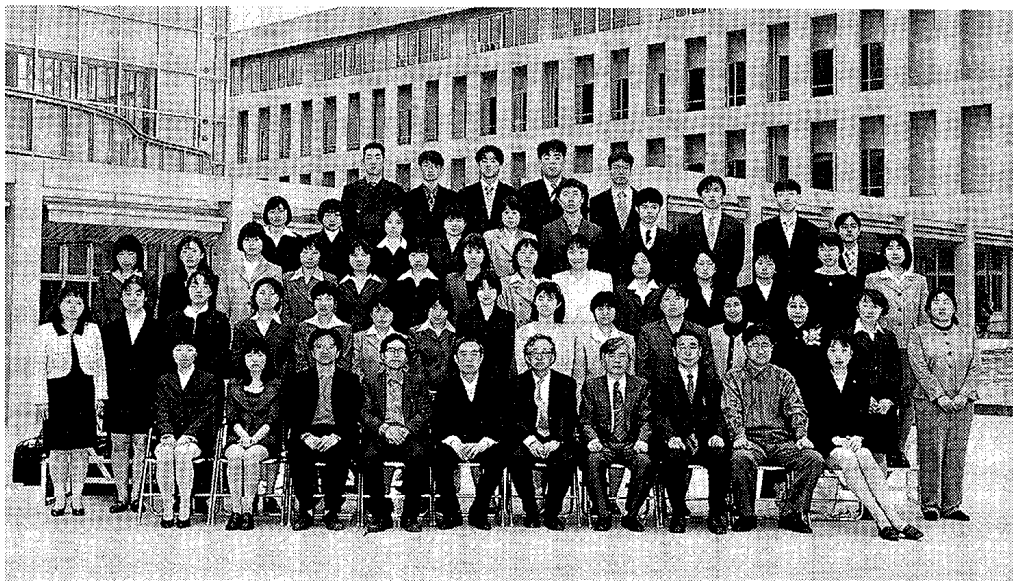
写真2 第1期生の入学式 ( '98年4月)

ここに'98年4月、新学科スタートに当たって新入生諸君のためのガイダンスに合わせて急いで作った手製の、「日本文化学科——履修の手引き——」があって、今、それを読み直している。日本文化学科設置のために文部省に提出した、「日本文化学科設置届出書」の内容の一部を学生諸君のためにアレンジしたものであるが、現在の、「日本文化学科の栞」に引き継がれている冊子である。学科設置の趣旨、研究・教育の目的、どのような人材を育成するか、東海地域との関わり、留学生の受け入れ、就職の見通し、取得できる免許・資格、とやや硬めの説明が続いている。