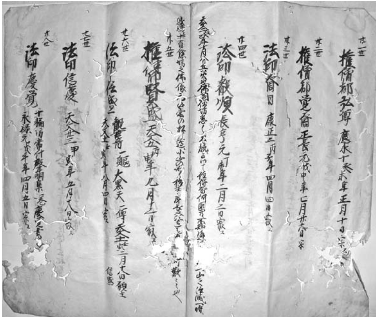
写真2 『代々忌日記』部分

『代々忌日記』ははじめ、十七世紀半ば頃作成されたものと思われ、それぞれの住職のうち、寺に残る記録類に名のある者はそれを注記している。よつ