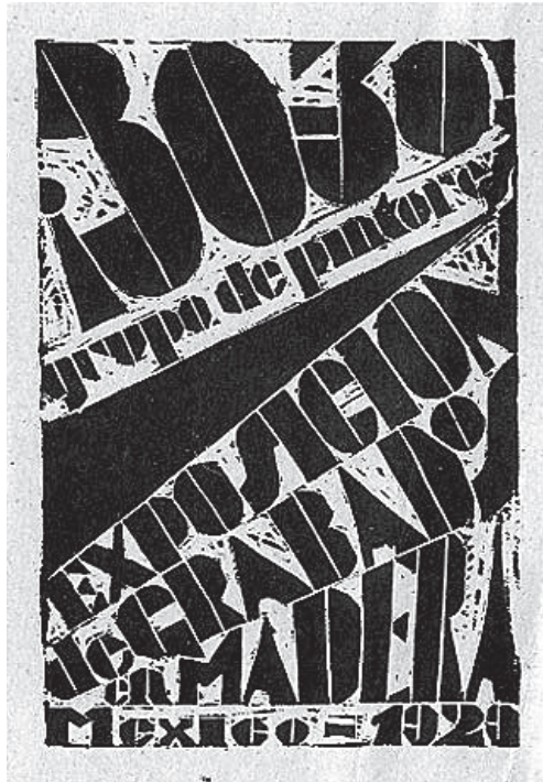
図2 Grupo ¡30-30! 版画展ポスター