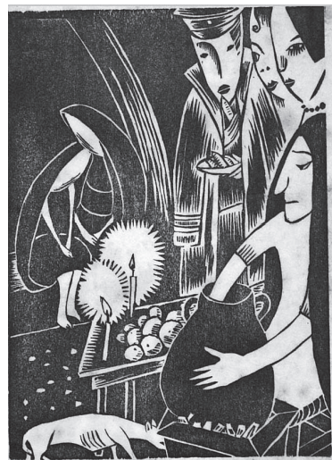
図4 「タマーレスを売る女」