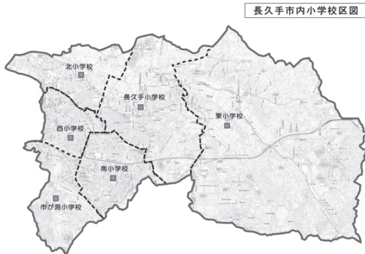
図2 長久手市小学校区

協働のまち」を掲げられているように、長久手市の政策にも反映されていくことになったのである。