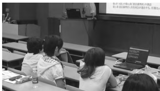
写真3 第3回ランチセミナーにおける字幕保障

字幕サービス利用者の近くに置かれたノートパソコン（右端、机上）と前方のスクリーンに、同時に情報が表示される。