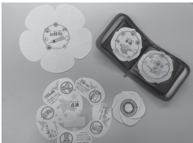
図1 勲章的花びら型プレパレーション・ツール

看護師は, 通常業務として, 幼児後期から学童前期(3~9歳)の小児が入院した際に, 入院案内のツール