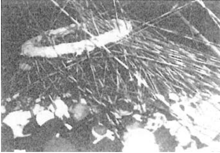
図2 神島ゲーター祭

『古事記』上巻「猿女の君」の項には、更に「是に猿田昆古神を送りて、還り到りて、乃ち悉く鱧の広物・鱧の狭物を追ひ聚めて」とあり、「還り到りて」は「日向国に還り到りて」と解釈されるが、これは日向国に還り到るのではなくて、志摩国に還り到るのではな