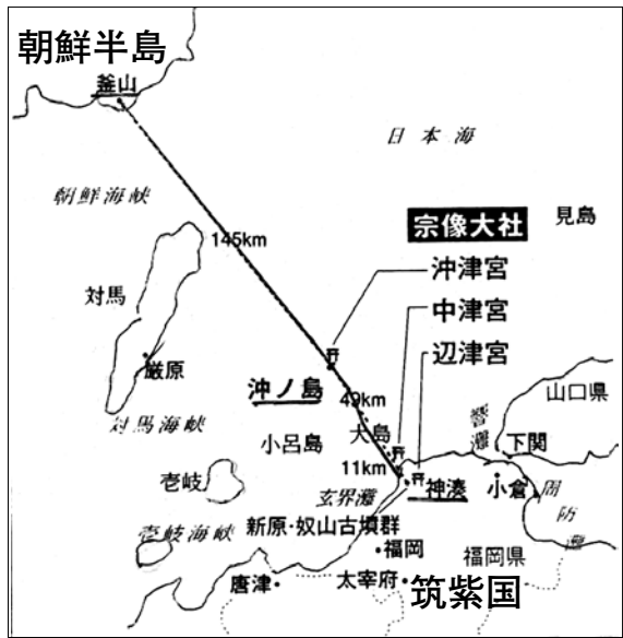
図4 沖ノ島関係地図 デアゴスティニー「日本の神社」より