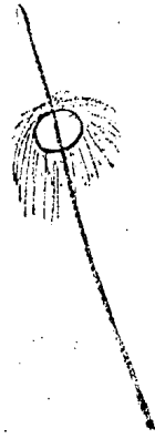
如此竹ニ掛ケホラシ 布ニテク、ルナリ